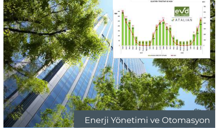
Enerji Yönetimi ve Otomasyon