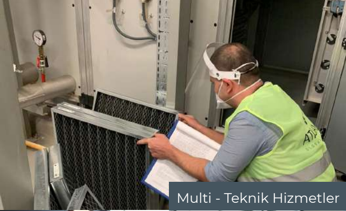
Multi - Teknik Hizmetler