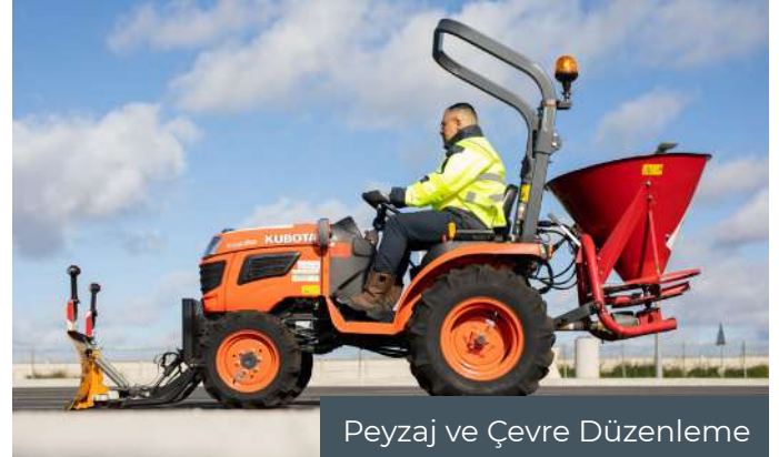
Peyzaj ve Çevre Düzenleme

ATALIAN, dünyanın önde gelen tesis yönetimi sağlayıcılarından biri olarak, tesislerinizin tamamen dezenfekte ve güvenli olmasını sağlamak için birinci kalite hizmetler sunmaktadır.