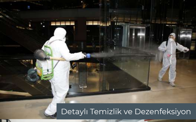
Detaylı Temizlik ve Dezenfeksiyon